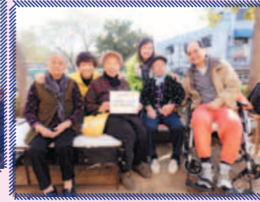
透過探訪，一嚐傳統小食