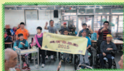
鼓舞隊到佛教東林安老院表演

感謝利駿行慈善基金的贊助，住宿照顧部的輪椅使用者，在導師及義工的協助下學習中國鼓藝。這群服務使用者雖然全是使用輪椅，但他們擁有一顆熱誠的心和毅力，努力不懈地練習，與義工們組成鼓舞隊一同走訪區內老人中心及院舍表演，推動關愛敬老之社會氣氛，從中亦鼓勵和協助了智障及殘疾人士全面融入家庭和社群中，增強他們的自信心，讓他們發展多方面的潛能。