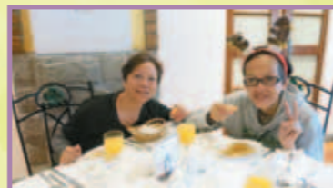
綺娟於澳門食葡國大餐