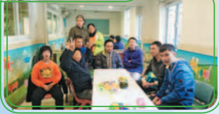
經過同工們及治療師的悉心關懷和全面的訓練下，他們已漸漸適應中心的生活