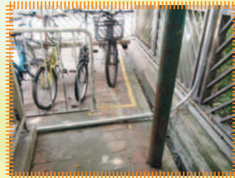
重整C座連接保安室之防水地線，確保中心外圍電力供應穩定