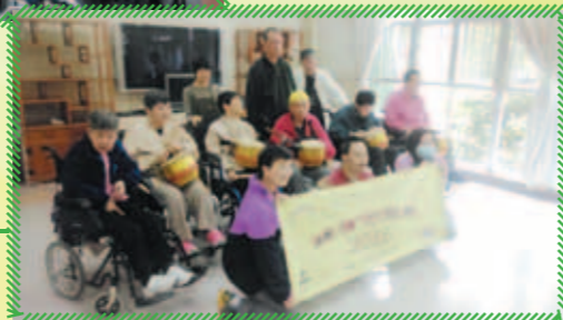
鼓舞隊到救世軍安老院表演