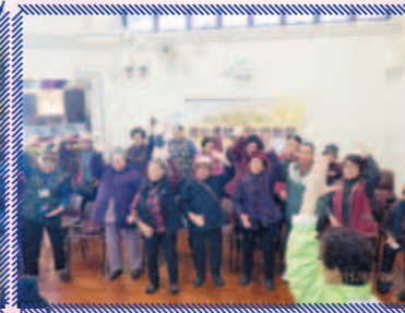
區內年青人為我們作嚮導