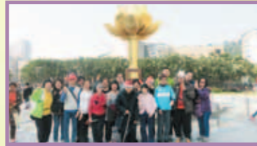
首次舉辦出境旅行活動