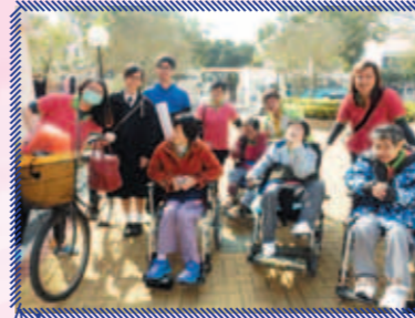
在治療師帶領下，與沙頭角居民一同舒展筋骨

由社會福利署大埔及北區義工服務協調委員會聯同住宿照顧部主辦，在春節前後，在蓬瀛仙館贊助下，與服務使用者一起跨越禁區，走入尋常百姓家，三度送暖到沙頭角這邊陲小鎮，以「尋安健體，家樂無窮」作關懷的切入點，與治療師一同帶著健康訊息與村民近距離接觸。