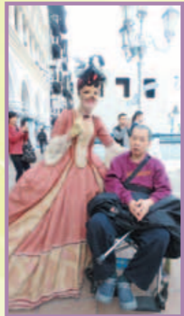
來澳門感受濃厚的節日氣氛