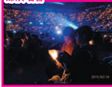
愛音樂的嘉豪和媽媽一同欣賞演唱會