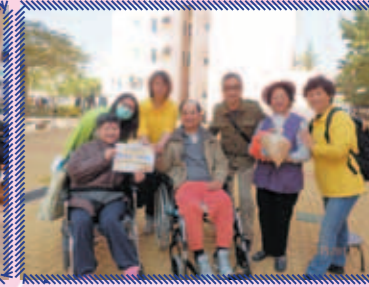
學員為區內長者帶來關懷與祝福