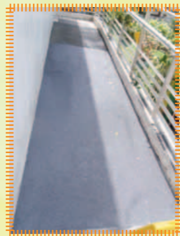
重鋪B214對出斜坡位置之防滑鋼沙