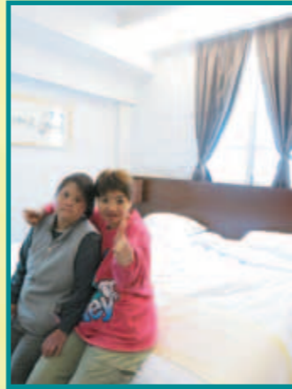
鳳儀對房間十分滿意，對房間讚口不絕