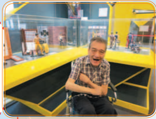
學員參觀沙田文化博物館

綜合服務部由2015年4月份開始，獲社署資助增設專為50歲或以上的年長智障人士而設的「延展照顧服務」。服務主要是以休閒及豐盛晚年為主，包括：健康講座、與家屬一起參與製作的學員的「人生譜」、由治療師編製的競技性的樂齡運動等等，都令一眾年長學員樂在其中。同時亦承蒙獲獎券基金撥款，中心增設為樂齡學員度身訂造的輔助裝置及設備，優化他們的生活質素及家居環境。