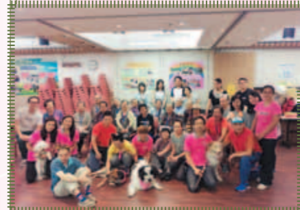
中心學員和社區青年連同狗醫生，一起探訪長者中心，宣揚愛護動物訊息

計劃得到香港動物輔助治療學會的導師協助，指導學員及義工如何照顧動物。經過一連串的培訓後，學員及義工們能學以致用，一起探訪機構及教導參加者如何善待動物，透過簡單的互動，例如撫摸小動物及「打招呼」，都能令大家流露出開心愉悅的笑顏，促進了大家彼此分享照顧動物的心得和經驗。計劃不但提升學員的自信心及成功感，更能加深義工對智障人士的認識，了解到他們是一班有愛心及願意用心學習照顧動物的人，亦熱心投入地區服務，達至傷健共融的精神。