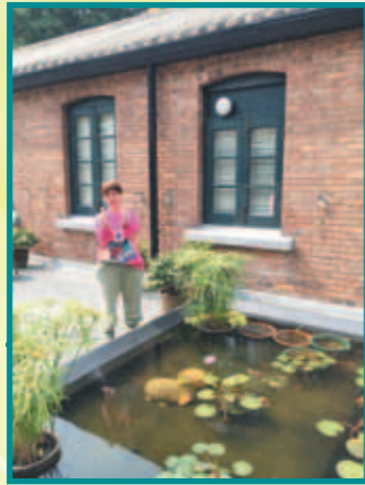
鳳儀很喜歡這荷花池