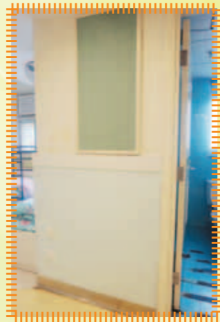
更換房間內已爛掉的防火板