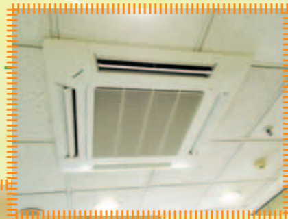
更換部份性能開始衰退的冷暖機，讓服務使用者在舒適的溫度下生活