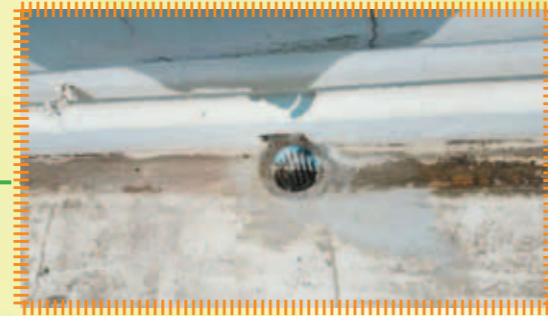
翻新5樓天台去水設施，改善去水情況