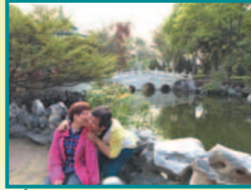
家寶與家人遊山玩水，親親母親