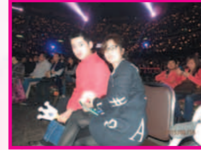
譚校長的歌聲令全場都好投入