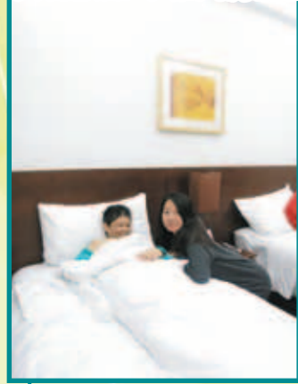
秀芬忍不住睡在酒店床