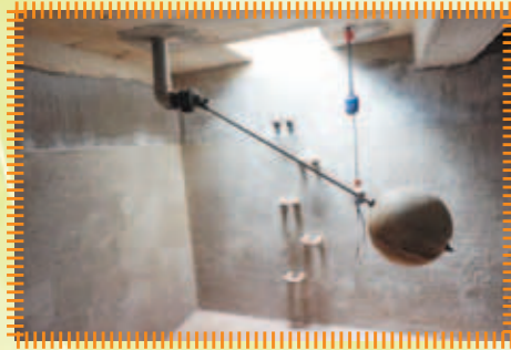
六樓天台消防水缸防漏工程