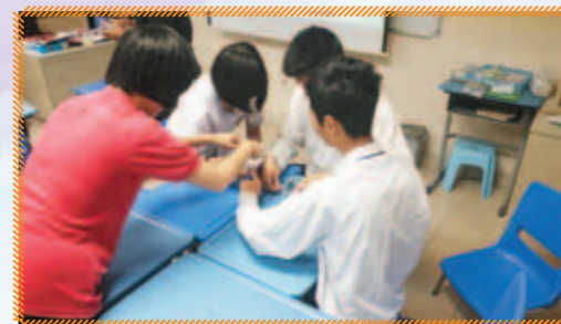
生涯規劃課程以課堂、歷奇體驗、嘉許禮和分享環節舉行

2015年4-6月匡智超卓服務隊為一所特殊學校的高中生試辦了一個全新的生涯規劃課程，內容包括自我認識、社交和工作要求，讓同學從中明白工作的價值和意義、認識自己、學習各類工作技巧及態度上要求等等，為自己的未來好好計劃路向。從反饋中，參加者反映能透過培訓課程，讓家長更了解子女，發現他們原來很多方面也能主動做到。學生也增加了信心，勇敢面對困難；學校老師和社工也看見同學主動投入參與課堂，並對認識自己有了新的得著。