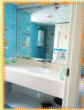
更換宿舍洗手間內之洗手盆下櫃