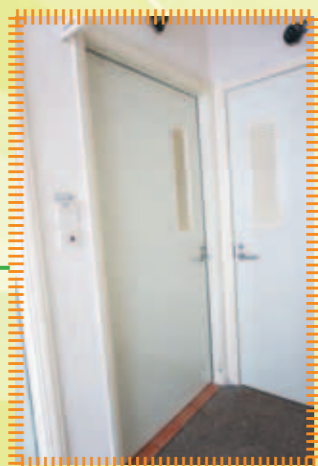
更換中心部份洗手間已霉爛之木門及門框