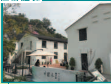
風景怡人，環境優美