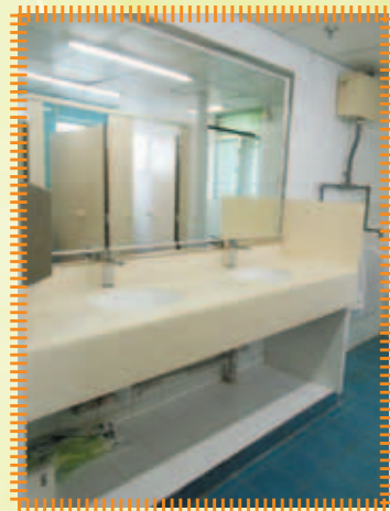
更換E座男更衣室洗手盆下櫃連鏡面