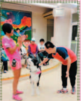
在青年義工指導下，學員溫柔地撫摸狗隻，得到義工拍掌鼓勵