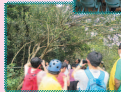
約30位舍友及同工一同前往鳳園參觀，實地了解蝴蝶的生態環境及演變情況