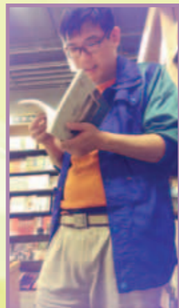
子健是位對懷舊建築情有獨鍾的文青，夢想擁有一本懷舊建築物的書本