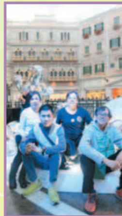
我們到威尼斯人一遊