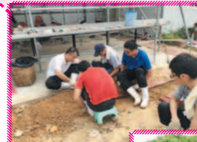
學生很努力完成所託付的工作，更親身在農田上幫忙興建香草植物螺旋、活動棚、溫室、澆水系統、地磚鋪設等的農田設施，得以讓新農田加快啟用

新一學期的服務學習於2015年9月份開展，共34位學生參加，分成5個組別，負責協助中心美化天台花園、紀錄匡智Love Garden的發展情況、運用環保物料美化農田、制訂農田風險評估，並協助籌辦2015年11月29日的社區有機及社區共融嘉年華。